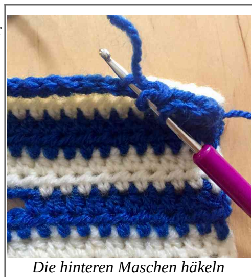
Die hinteren Maschen häkeln

Rd 1: Blaues Garn; Für den Knick nur die hinteren Maschen häkeln. 35 hStb (lange Seite) + 16 hStb (kurze Seite) + 35 hStb (lange Seite) + 16 hStb (kurze Seite). Insgesamt 102 Maschen. Die Runde mit einer Km schließen und eine Lm für die Erhöhung