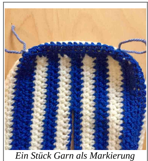
Ein Stück Garn als Markierung